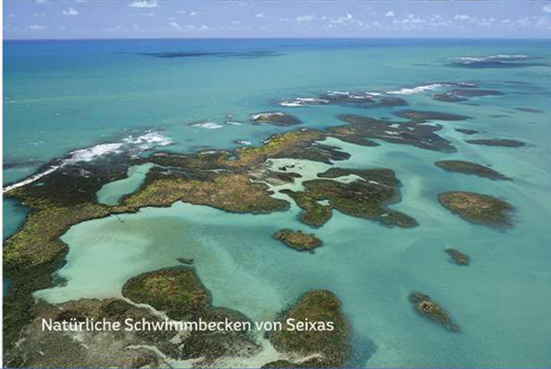
Natürliche Schwimmbecken von Seixas