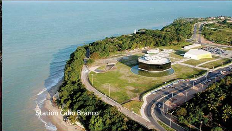
Station Cabo Branco